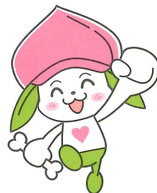
協会けんぽ福島支部マスコットキャラクター ケンタくん