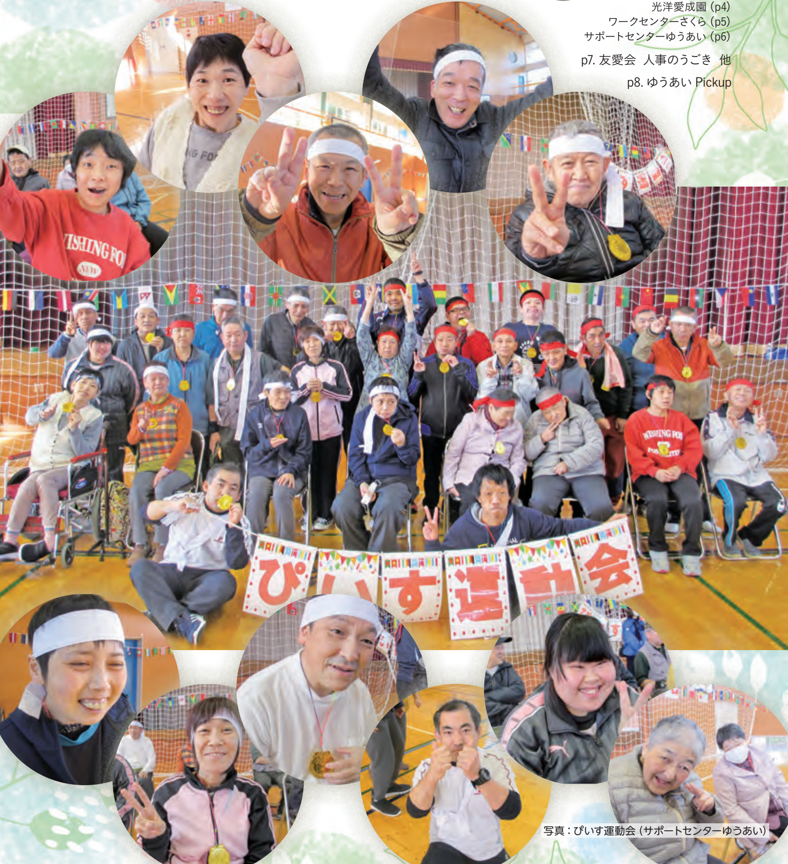
写真：びいす運動会（サポートセンターゆうあい）